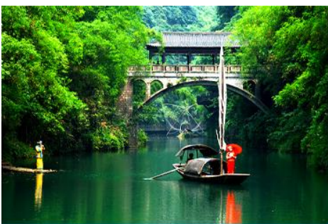
หมู่บ้านชาบลี

พักที่ YICHANG HUIHAO HOTEL โรงแรมระดับ 4 ดาวหรือเทียบเท่าในเมืองหยี่ชาง