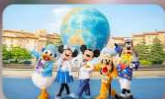
อิสระตามอริยาซึย 2 วัน

HOTEL ASIA NARITA ห้องเดี่ยวท่านมาตรฐานญี่ปุ่น