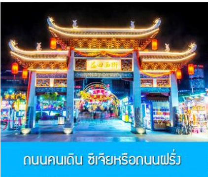
ถนนคนเดิน ซีเจียหรือถนนฝรั่ง