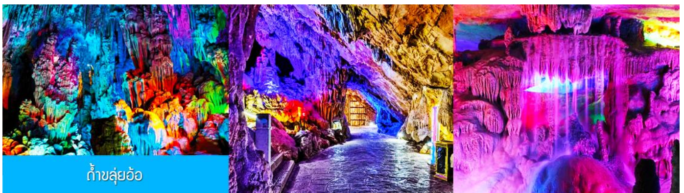
ถ้ำขลุ่ยอ้อ

พักที่ VIENNA INTER HOTEL ระดับ 4 ดาวท้องถิ่นหรือเทียบเท่าในเมืองกุ้ยหลิน