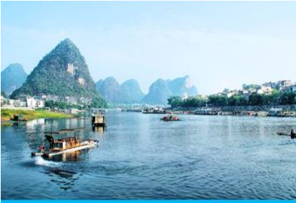
ล่องเรือแพ ณ ท่าเรือริมแม่น้ำหลีเจียง