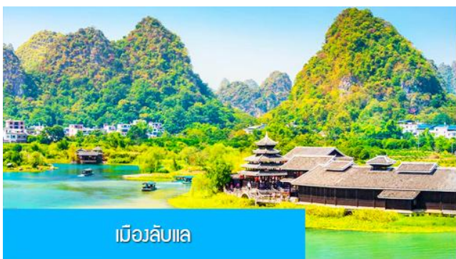
เมืองลับแล