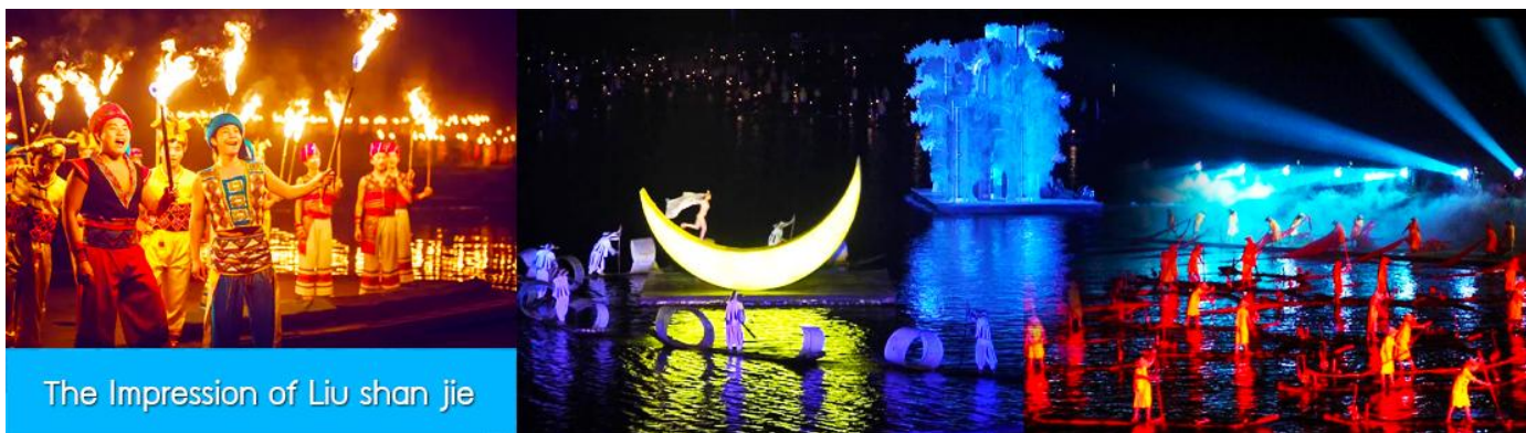
The Impression of Liu shan jie

จากนั้นนำท่านเดินทางเข้าที่พัก หรือท่านสามารถเลือกซื้อโปรแกรมเสริม เป็นบัตรชมการแสดง ชุด The Impression of Liu shan jie หรือที่เรียกกันในหมู่นักท่องเที่ยวไทยว่า โชว์แม่น้ำ เป็นการแสดงบนแม่น้ำหลีเจียงที่ทุ่มทุนสร้างอย่างสุดอลังการ เป็นการแสดงที่น่าดูชมที่สุดในเมืองกุ้ยหลิน การแสดงชุดนี้ใช้แม่น้ำหลีเจียงเป็นเวทีการแสดง โดยมีฉากหลังเป็นภูเขาริมแม่น้ำ ซึ่งให้ความรู้สึกสมจริงเสมือนผู้ชมและนักแสดงอยู่ท่ามกลางธรรมชาติ ใช้ทีมงานนักแสดงหลายร้อยคน และระบบแสง สี เสียง ที่ทันสมัยประกอบในการแสดง