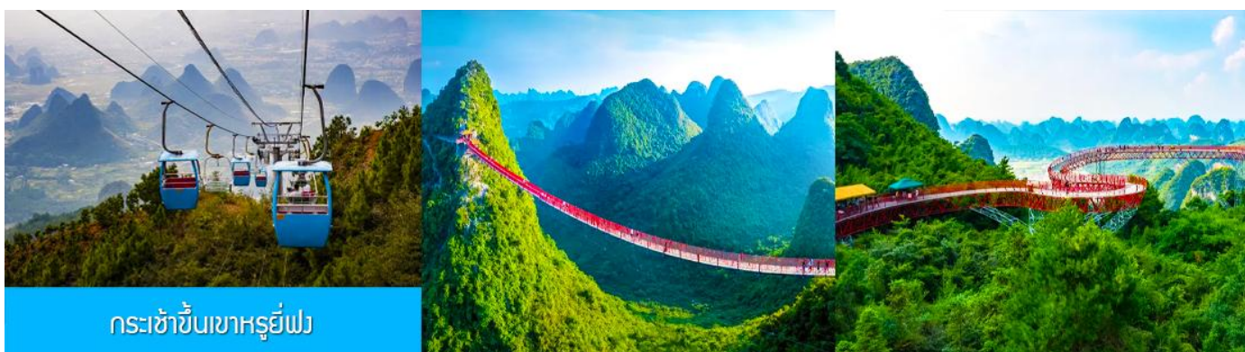
กระเช้าขึ้นเขาหฺรูยี่ฟง

อัตราค่าบริการสำหรับโปรแกรมเสริมการแสดงชุด The Impression of Liu san jie ท่านละ 350 หยวน ระยะเวลาที่ใช้ในการเที่ยวชมการแสดง ประมาณ 2 ชั่วโมงครึ่ง รวมเวลาเดินทางไป กลับ ค่าบริการรวม ค่าบัตรเข้าชม ค่ารถรับ ส่ง และค่าน้ำดื่มของไกด์ท้องถิ่น พักที่ YANGSHUO ELITE HOTEL ระดับ 4 ดาวท้องถิ่นหรือเทียบเท่าใน เมืองหยางชัว