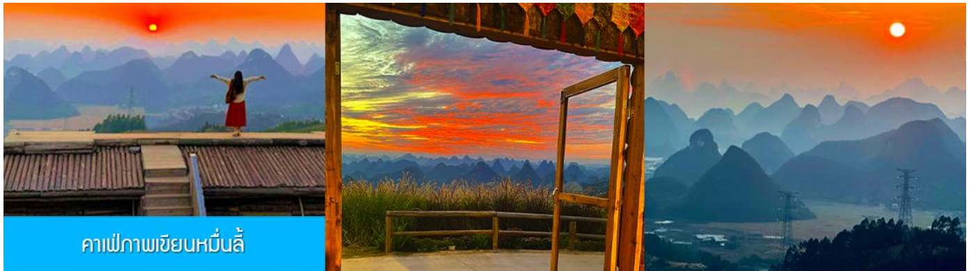
คาเฟ่ภาพเขียนหมื่นลี้

รับประทานอาหารกลางวัน ณ ภัตตาคาร (มื้อที่ 5)