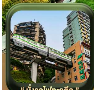
“ นิ่งรโฝทะลุติก ”

บินตรงลงวงชิง • อุ้หลง หลุมฟ้าสะพานสวรรค์ • ระเบิดยงแก้ว • อุทยานเขานางฟ้า หงหยาดัง • นิ่งรโฝทะลุติก • ศาลาประชาคม (ด้านนอก) • หลงหมินฮ่าว มรดกโลกพาหินแกะสลักต้าจู้ • วัดหลิวอัน • ตึกตะเกียบ • ถนนคนเดินเจียฟ้างเปย