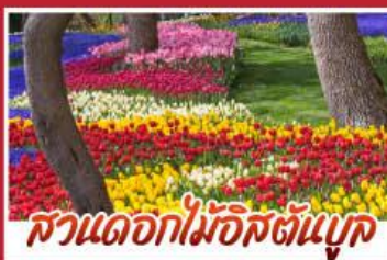
สวนดอกไม้อิสตันบูล