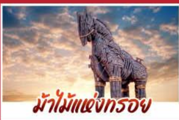
น้ำไม้แห่งกรวย