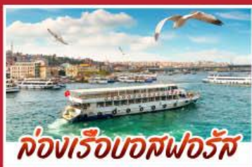
ล่องเรือบอสฟอรัส