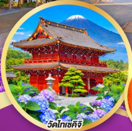
วัดโทเชคิจิ