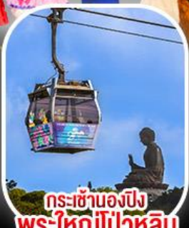
กระเช้าองปีง พระใหญ่ไผ่หลิน