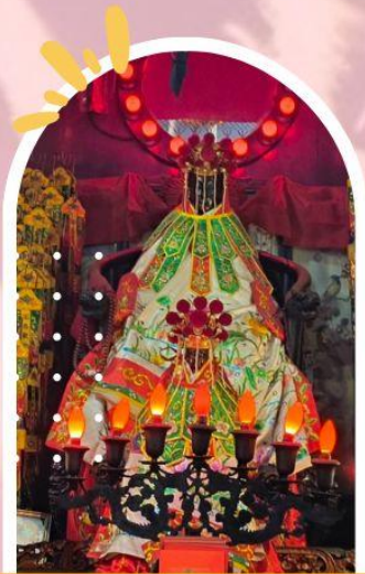
วัดเจ้าแม่กวนอิมฮ่องกง ขอพรเรื่องเงิน ทรัพย์สิน และความมั่งคั่ง