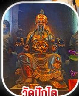
วัดปีงโต