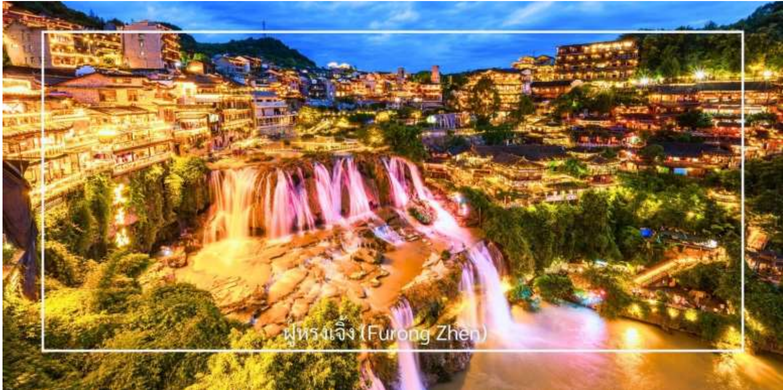
ฟูรงเจิ้ง (Furong Zhen)

ท่านสามารถเลือกซื้อบริการเสริม (Option) เพิ่มเติมได้: ถ้ามังกรเหลือง (รวมล่องเรือชมแสงสีในถ้ำ ราคา 350หยวน/ท่าน) ถ้ามังกรเหลือง หนึ่งในถ้ำหินงอกหินย้อยที่ยิ่งใหญ่และงดงามที่สุดของเมืองจางเจี๋ยเจี๋ย แหล่งท่องเที่ยวทางธรรมชาติที่ได้รับการยกย่องว่าเป็น “พระราชวังใต้พิภพ” แห่งดินแดนอุ๋นลี่หยวน ถ้ำแห่งนี้มีโครงสร้างขนาดใหญ่ แบ่งออกเป็น 4 ชั้น ภายในประกอบด้วยห้องโถงกว้างใหญ่ ลำธารใต้ดิน บึงธรรมชาติ และแนวระเบียงหินที่ทอดยาวอย่างน่าตื่นตา ความมหัศจรรย์ของหินงอกหินย้อยซึ่งก่อตัวสะสมมาเป็นเวลาหลายล้านปี ได้รับการจัดแสงอย่างสวยงาม ช่วยขับเน้นรูปร่างแปลกตาให้โดดเด่นราวงานศิลป์จากธรรมชาติ สัมผัสประสบการณ์ ล่องเรือชมแสงสีภายในถ้ำ โดยเรือจะนำท่านลัดเลาะไปตามสายน้ำใต้ถ้ำให้ท่านได้สัมผัสกับความยิ่งใหญ่ของธรรมชาติอันน่าอัศจรรย์ได้อย่างใกล้ชิด