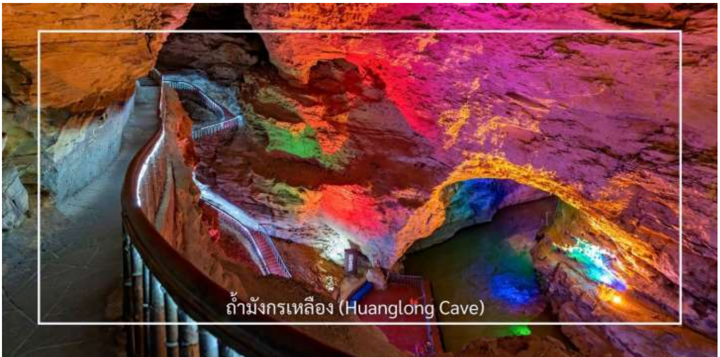
ถ้ามังกรเหลือง (Huanglong Cave)

ท่านสามารถเลือกซื้อบริการเสริม (Option) เพิ่มเติมได้: ถ้ามังกรเหลือง (รวมล่องเรือชมแสงสีในถ้ำ ราคา 350หยวน/ท่าน) ถ้ามังกรเหลือง หนึ่งในถ้ำหินงอกหินย้อยที่ยิ่งใหญ่และงดงามที่สุดของเมืองจางเจี๋ยเจี๋ย แหล่งท่องเที่ยวทางธรรมชาติที่ได้รับการยกย่องว่าเป็น “พระราชวังใต้พิภพ” แห่งดินแดนอุ๋นลี่หยวน ถ้ำแห่งนี้มีโครงสร้างขนาดใหญ่ แบ่งออกเป็น 4 ชั้น ภายในประกอบด้วยห้องโถงกว้างใหญ่ ลำธารใต้ดิน บึงธรรมชาติ และแนวระเบียงหินที่ทอดยาวอย่างน่าตื่นตา ความมหัศจรรย์ของหินงอกหินย้อยซึ่งก่อตัวสะสมมาเป็นเวลาหลายล้านปี ได้รับการจัดแสงอย่างสวยงาม ช่วยขับเน้นรูปร่างแปลกตาให้โดดเด่นราวงานศิลป์จากธรรมชาติ สัมผัสประสบการณ์ ล่องเรือชมแสงสีภายในถ้ำ โดยเรือจะนำท่านลัดเลาะไปตามสายน้ำใต้ถ้ำให้ท่านได้สัมผัสกับความยิ่งใหญ่ของธรรมชาติอันน่าอัศจรรย์ได้อย่างใกล้ชิด