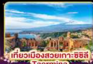
เที่ยวเมืองสวยเกาะซซิลี Taormina