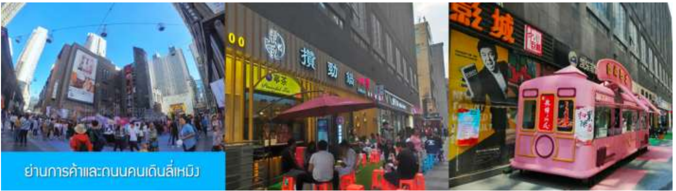
ย่านการค้าและถนนคนเดินลีเหมิง

หลังอาหารนำท่านสู่ ย่านการค้าและถนนคนเดินลีเหมิง 力盟商业步行街 ย่านการค้าทันสมัยที่มีห้างสรรพสินค้าขนาดใหญ่หลายแห่ง ถนนคนเดินที่คึกคักไปด้วยร้านค้าแบรนด์ท้องถิ่น ร้านอาหารพื้นเมือง ร้านสะดวกทานฟาสต์ฟู้ด ให้เวลาอิสระท่านเดินช้อปปิ้ง ชิมอาหารพื้นเมืองเต็มที่