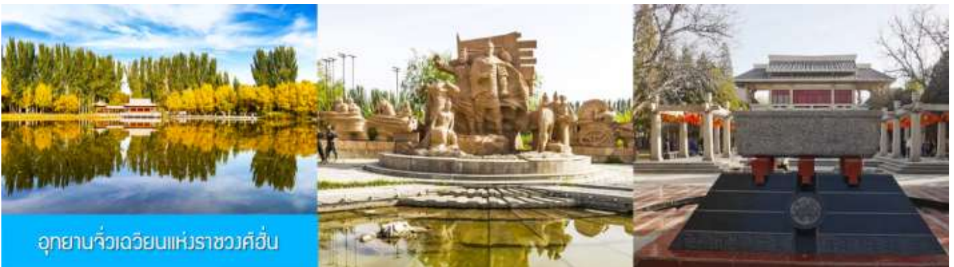
อุทยานจิวเจี๋ยนแห่งราชวงศ์ฮั่น

จากนั้นนำท่านเดินทางสู่เมืองจิวเจี๋ยน (ระยะทาง 50 กม. ใช้เวลาเดินทาง 1 ชั่วโมง)