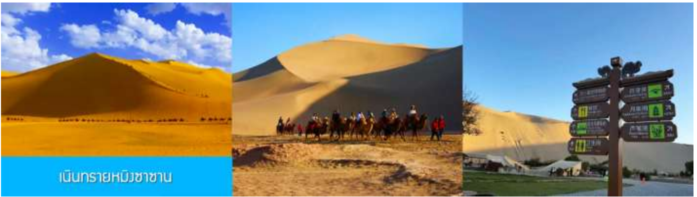
เนินทรายหมิงซาซาน