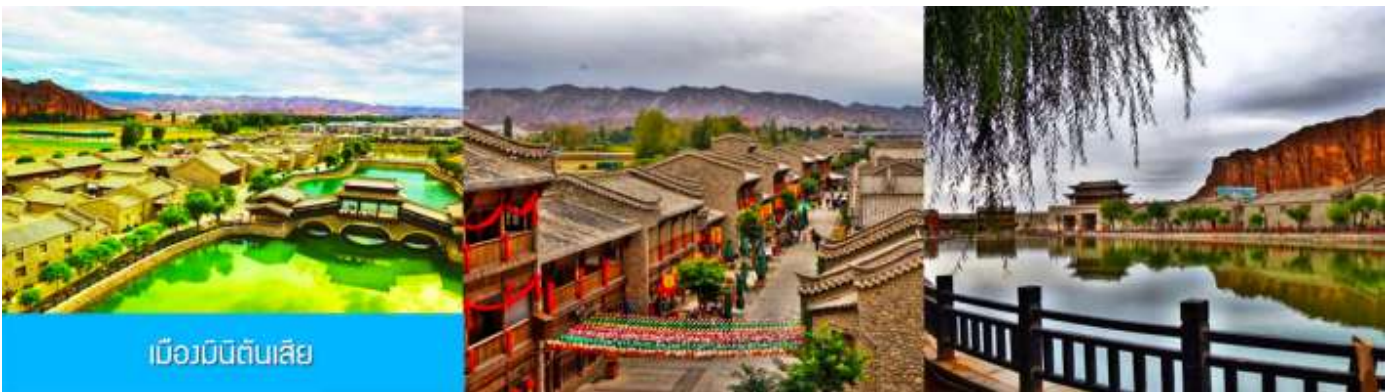
เมืองมินดินสี