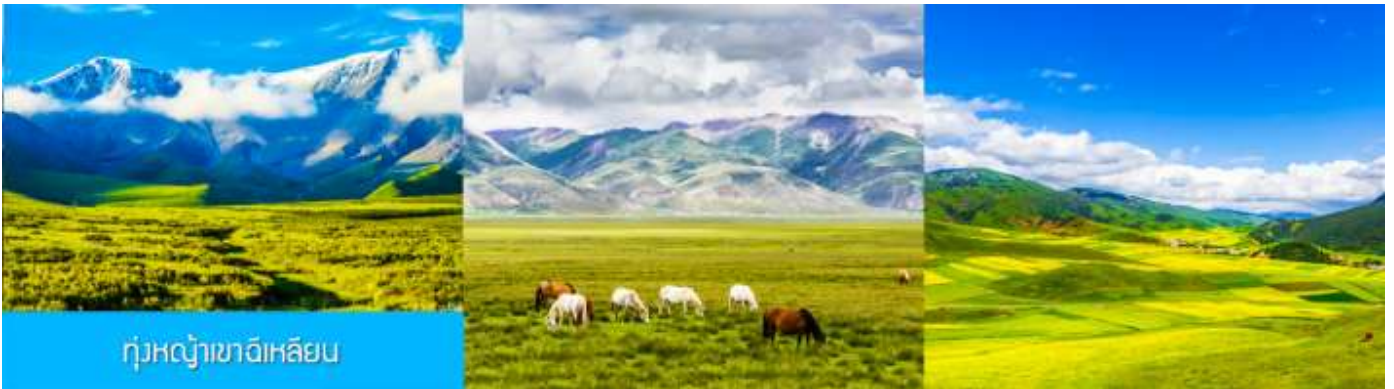
ทุ่งหญ้าฉีเหลียน

จากนั้นนำท่านเดินทางโดยรถบัสสู่ทุ่งหญ้าฉีเหลียน (ระยะทาง 140 กม. ใช้เวลาเดินทางประมาณ 2 ชั่วโมง)