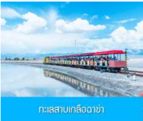
ทะเลสาบเกลือฉาซ่า

เช้า รับประทานอาหารเช้า ณ ห้องอาหารของโรงแรม (1) หลังอาหารเช้าท่านเดินทางโดยรถบัสสู่ทะเลสาบฉาซ่า (ระยะทาง 289 กม.ใช้เวลาเดินทางราว 3 ชั่วโมงเศษ) เที่ยง รับประทานอาหารกลางวัน ณ ภัตตาคาร (2)