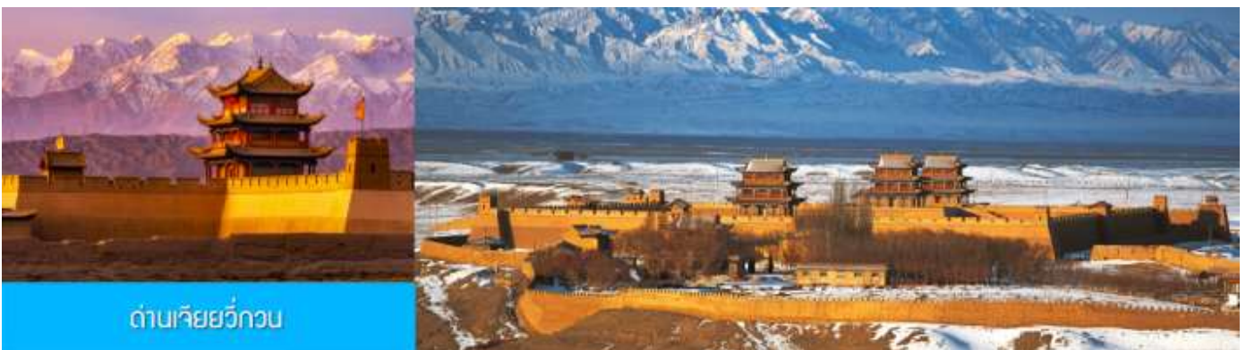
ด่านเจียยวี่กวน

รับประทานอาหารเช้า ณ ห้องอาหารของโรงแรม (12)