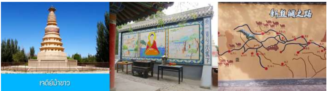
เจดีย์ม้าขาว

เที่ยง รับประทานอาหารกลางวัน ณ ภัตตาคาร (10)