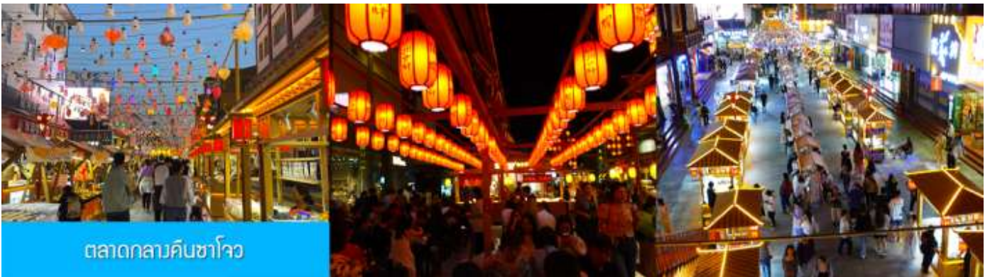
ตลาดกลางคืนซาโจว