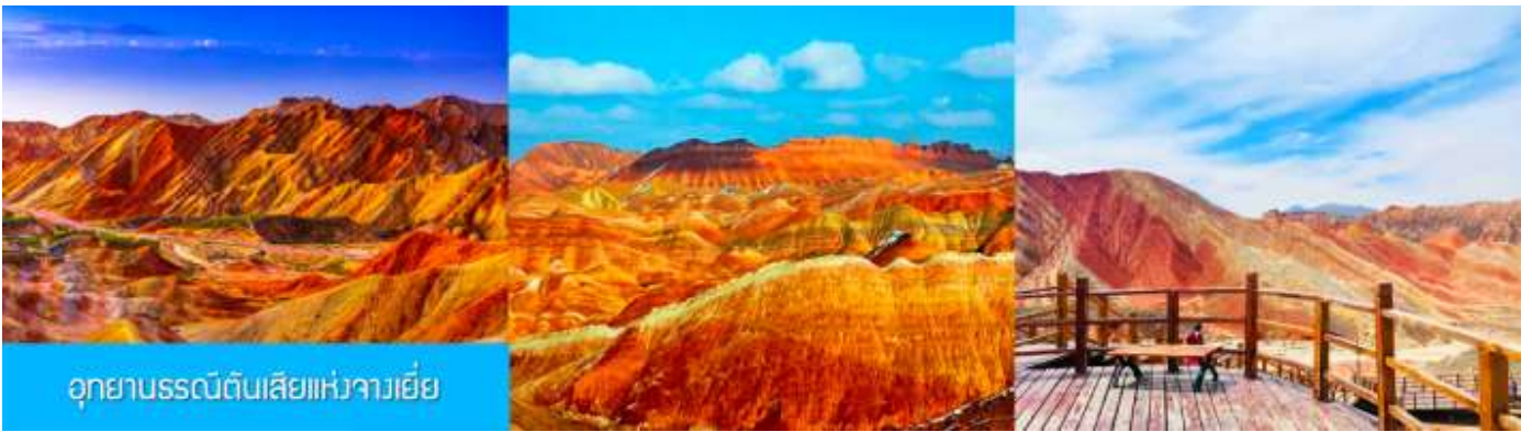
อุทยานธรณีดินสีแห่งจางเยี่ย