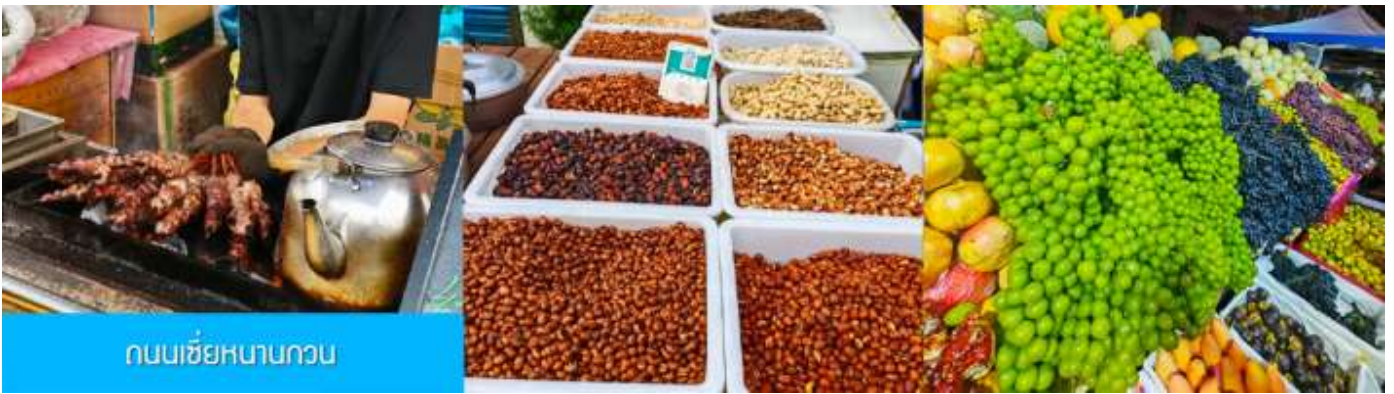
ถนนเซี่ยหนานกวน