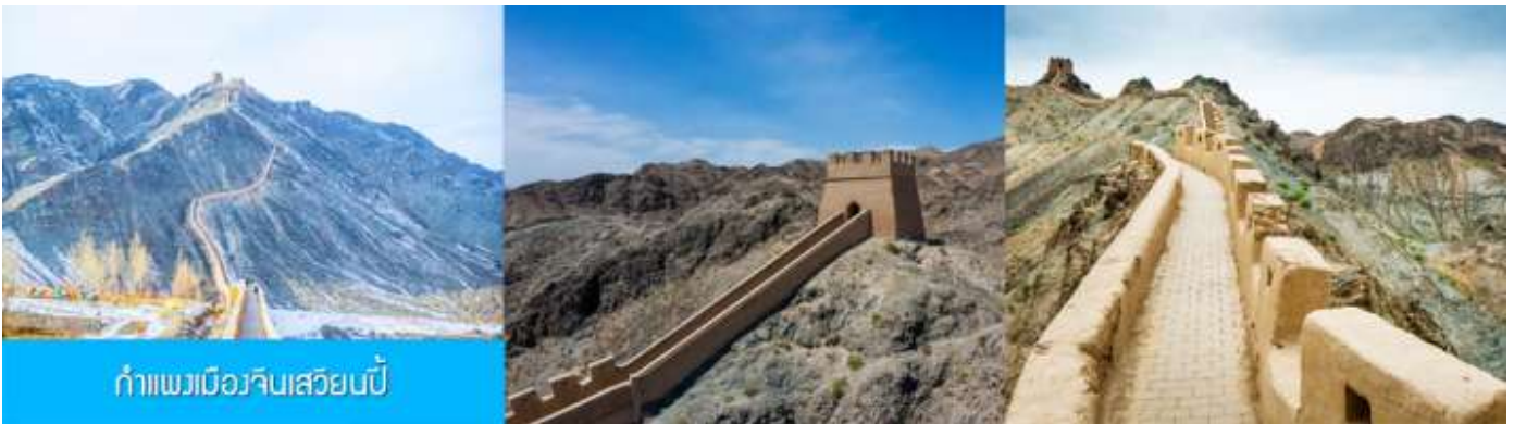
กำแพงเมืองจีนเสียนเป่