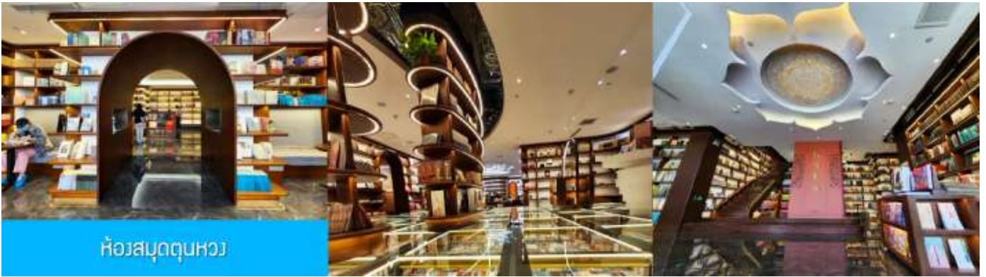
ห้องสมุดตุนหวง