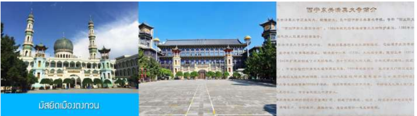
มัสยิดเมืองตงกวน

เช้า บริการอาหารเช้า ณ ร้านอาหารในโรงแรม (17)