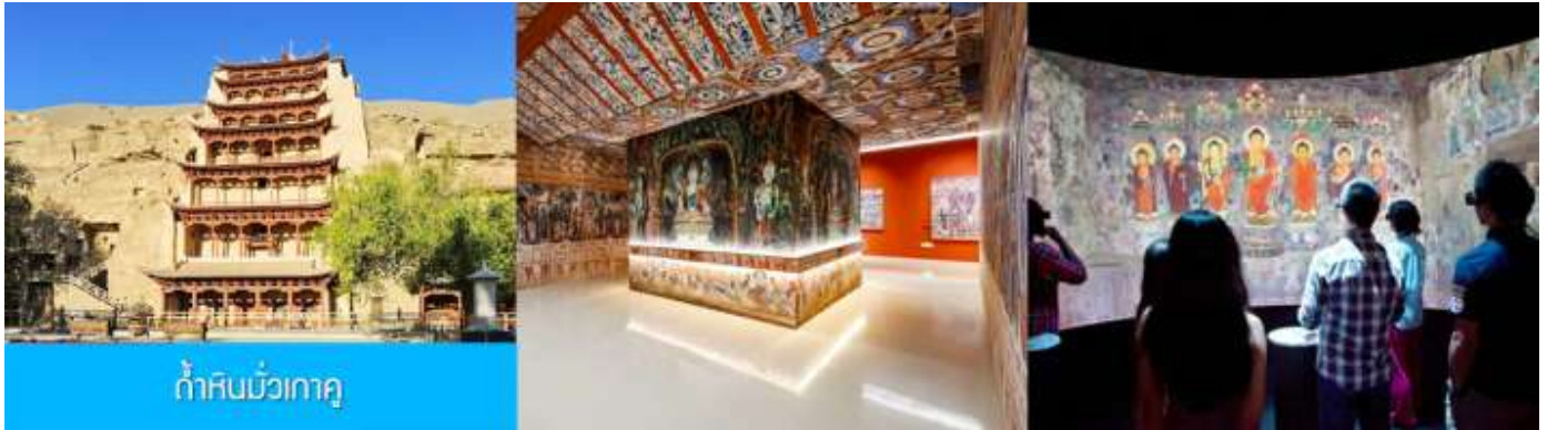
ถ้ำหินมั่วเกาถู

เช้า รับประทานอาหารเช้า ณ ห้องอาหารของโรงแรม (9)