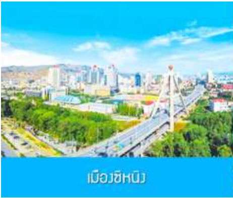
เมืองซีหนิง