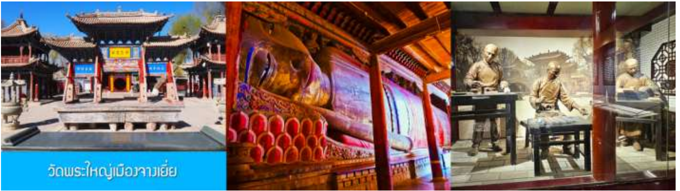
วัดพระใหญ่เมืองจางเยี่ย