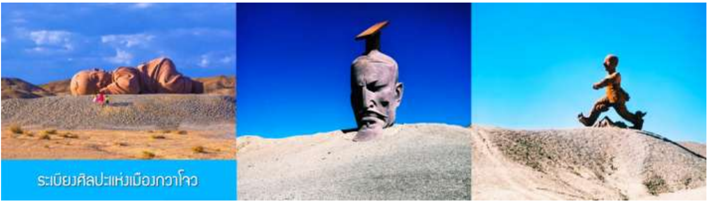
ระเบียบศิลปะแห่งเมืองกวาโจว