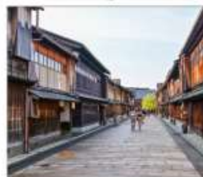
ย่านโรงน้ำชาอิงาชิซายะ