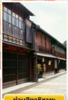
ย่านอิงาชิบายะ