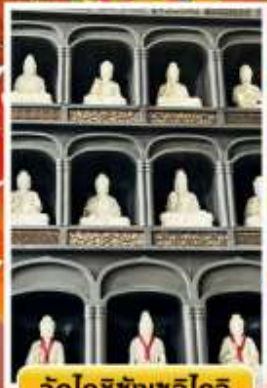
วัดไดชิซังเซอิไดจิ