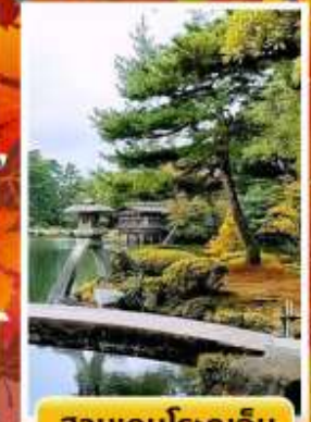
สวนเคนโระคุเอ็น

☁️ ออนเซ็น 3 คับ 🧺 นน.กระเป๋า 23 กก. ☀️ 7Days 5Night