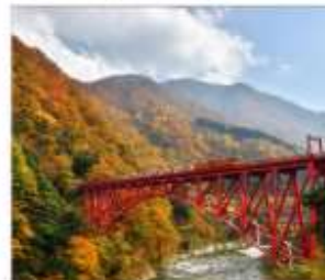
รถไฟชมวิวยุขุมเงาคุโรมะ