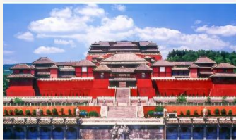
เมืองถ่ายภาพยนตร์