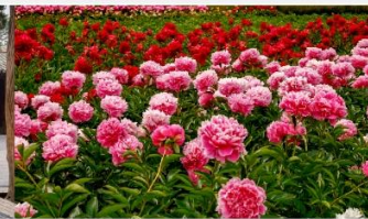
สวนดอกโบตั๋น