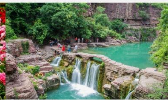
อุทยานหยุ่นโถซาน

*ทางบริษัทฯ ขอสงวนสิทธิ์ในการสลับโปรแกรมทัวร์ตามความเหมาะสมขึ้นอยู่กับสถานการณ์หน้างาน โดยคำนึงถึงผลประโยชน์ของลูกค้าเป็นสำคัญ