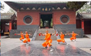
โชว์แสดงกังฟู