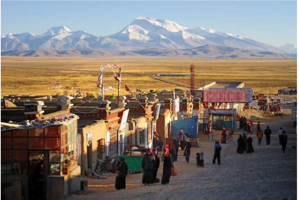
ที่พัก Dharchen Himalaya hotel