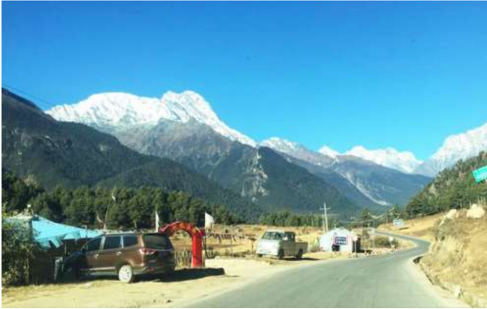
พาท่านเดินทางสู่ด่านพรมแดน จีน-เนปาล ใช้เวลาเดินทาง 1 ชั่วโมงโดยประมาณ