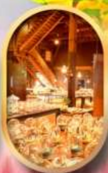
พิพิธภัณฑ์ถ้ำลอดดนตรี