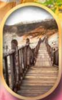
หุบเขาจิทอกุคาบิ