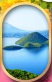
วิวทะเลสาบโทโยะ