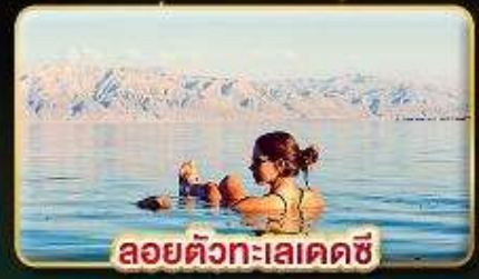
ลอยตัวทะเลเดคซี