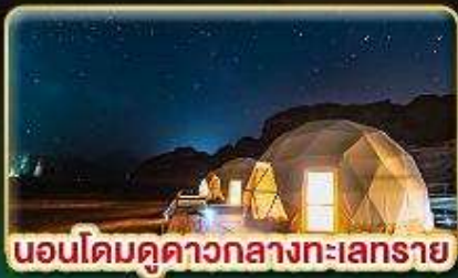
นอนโดมดูดาวกลางทะเลทราย

★ บินตรงสู่ "จอร์แดน" เยือน 7 มหัศจรรย์ของโลก