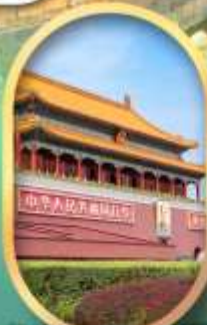
จัสมุทรีสเกี้ยนอันเหิน