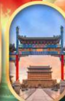
ถนนคนเดินเวียนเหิน