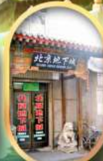
เมืองโบราณใต้ดิน