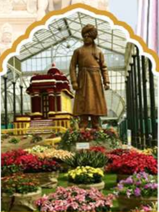
บังกาลออร์