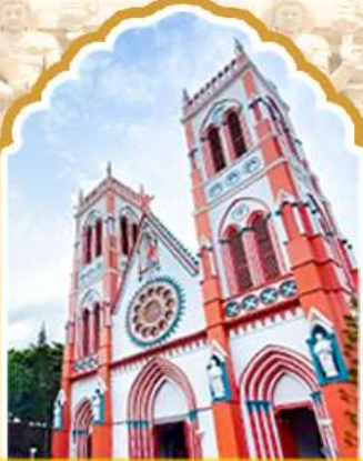
ปอนดีเซอริ้