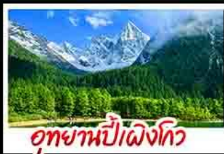
อุทยานป่าเผิงโกว

อุทยานสัตว์ดุณี - อุทยานป่าเผิงโกว - เมืองตุเจียงเซียง - รูปปั้นเขมร/แพนด้าบนเขาคังเฟี ร้านหนังสือจงชู่เกอ - ล่องเรือชมเขาวงพ้อโตเล่อซาน - ถานโบราณเซียงกวางชอยแคบ - วัดต้าซือ ถนนคนเดินซันซีลู่ - เข็มแพนด้าปิ่นตึกIFS - ถานที่ทุ่งเคี - ชมแสงสีน้ำพุ่มไฟฟลิก SKP - ชมตึก/เฟอเจิงตุ