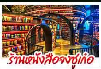
ร้านหนังสือจงชู่เกอ