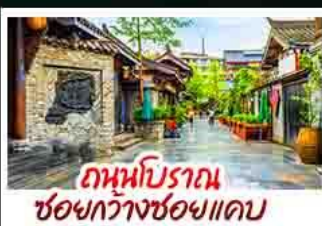
ถานโบราณ ชอยกวางชอยแคบ