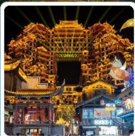
ตึกหอคจรรย 72