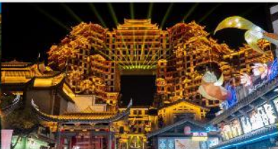
ตีทมห้ศจสรย์ 72