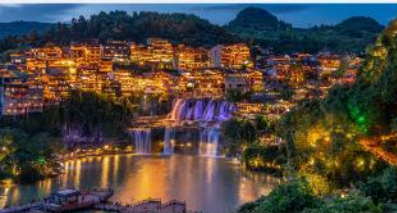
หมู่บ้านโบราณฝูหรงเจิน