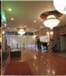
Asia Narita Hotel