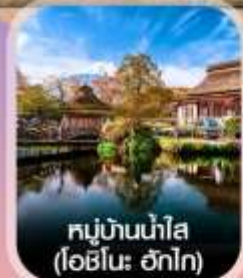
หมู่บ้านน้ำใส (โฮชิโนะ ฮักโก)