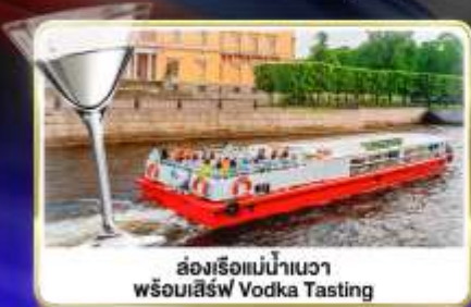
ล่องเรือแม่น้ำเนวา พร้อมเสิร์ฟ Vodka Tasting