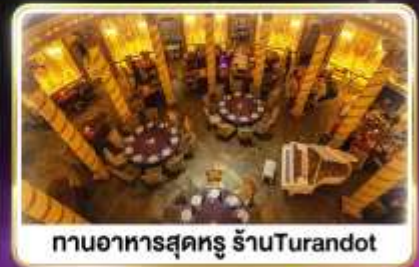
กานอาหารสุดหรู ร้านTurandot