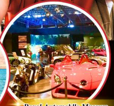
Royal Automobile Museum