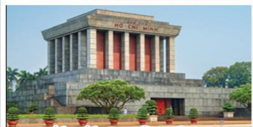
จัตุรัสบาติงห์