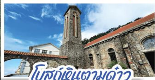
โบสถ์หินตามด้าว