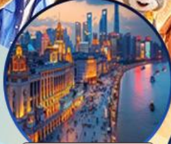
หาดไวทาน