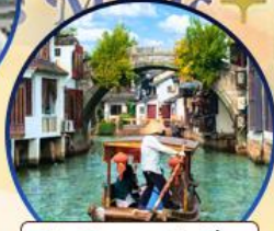
เมืองโบราณจูเจียเจีย