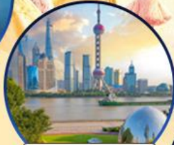
นอร์ทปิ่น กรีนแลนด์