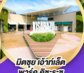
มิตซูเอะอิเกะอิเล็ค พาร์ค คิชะระชู