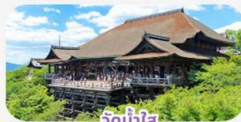
วัดน้ำใส