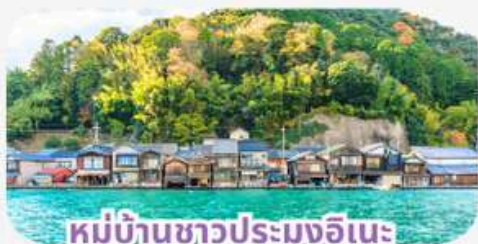
หมู่บ้านชาวประมงอิเนะ