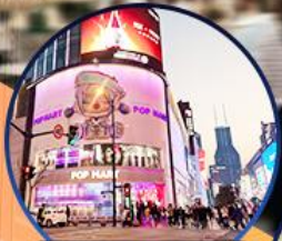
ถนนหนานจิง