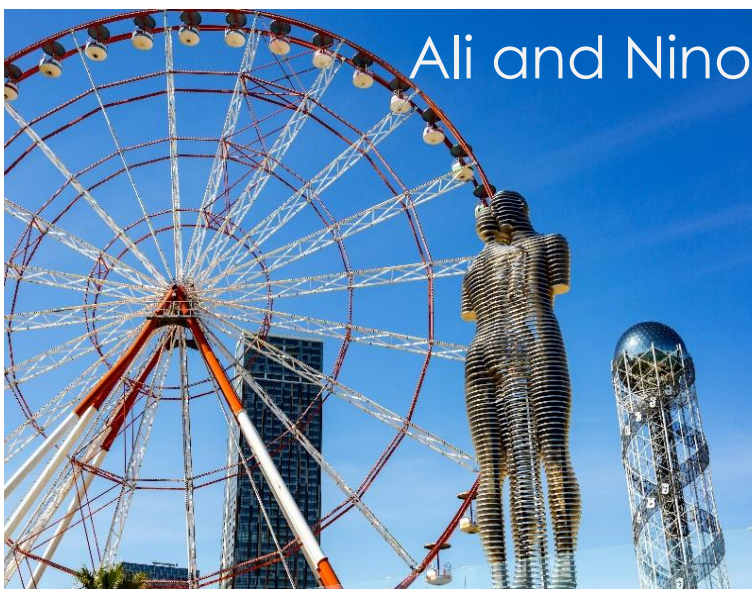
Ali and Nino

จากนั้นนำท่านสู่ถนนเลียบชายหาดบาตูมิ (Batumi Promenade) ถนนเลียบชายหาดที่ยาวถึง 6 กิโลเมตร สร้างขึ้นตั้งแต่ปี ค.ศ. 1884 ประดับด้วยน้ำพุงดงามตลอดสาย และเป็นถนนที่ยาวที่สุดบนชายหาดทะเลดำ ทศนิยมภาพผสมผสานวิวกูเขาและวิวทะเล นำชมแลนด์มาร์คสำคัญๆ ตลอดถนน ชมอนุสาวรีย์อาลีและนีโน (Ali and Nino Monument) เป็นสถาปัตยกรรมโลหะสมัยใหม่ ทำด้วยเหล็ก เคลื่อนไหวได้ ความสูงประมาณ 8 เมตร ผลงานศิลปินชาวจอร์เจีย Tamara Kvesitadze ที่บอกเล่าเรื่องราวความรักและความเศร้าของ อาลี หม่อมมุสลิม กับเจ้าหญิงนีโน แห่งจอร์เจีย หลังจากถูกกองทัพโซเวียตรุกราน จากวรรณกรรมของนักเขียนชาวอาเซอร์ไบจาน นอกจากนี้ยังมีความพิเศษคือรูปปั้นนี้ จะขยับเข้าหากันในเวลา 19.00 น.ของทุกวัน ถ่ายรูปกับหอคอยอิงซ์ซาวร์ค (Alphabetic Tower) ที่ตั้งริมทะเล