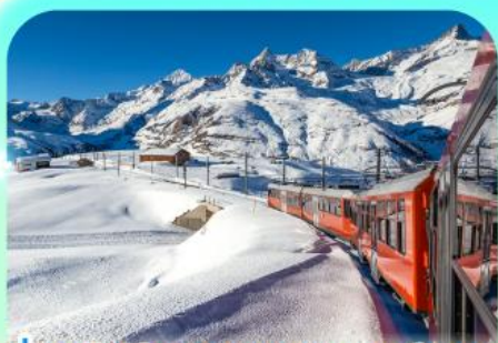
นั่งรถไฟสู่ยอดเขารอนเนอร์กเรต