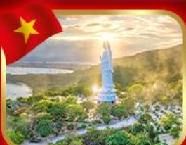
ขอพรกวอิม วัดหลินอึ้ง