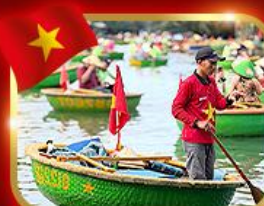
เรือกระด้ง หมู่บ้านกัมทาน