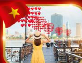
เช็किनสะพานแห่งความรัก