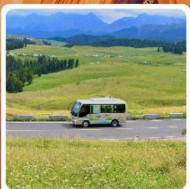
ทุ่งหญ้าเจียบปูลาค้อ