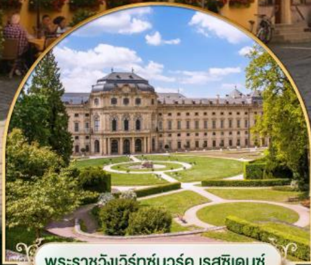
พระราชวังเวิร์ทซ์บวร์ค เรสซิเดนซ์