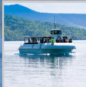
“LAKE SHIKOTSU GLASS BOAT”