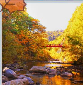
“JOZANKEI FUTAMI BRIDGE”