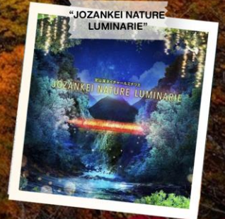
“JOZANKEI NATURE LUMINARIE”

วันเดินทาง 23 - 28 ต.ค. 2569 (วันปืยมหาราช) 28 ต.ค. - 2 พ.ย. 2569 30 ต.ค. - 4 พ.ย. 2569