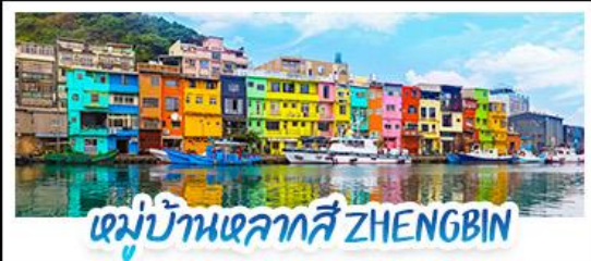
หมู่บ้านหลากสี ZHENGBIN

18 - 21 ก.ค. 69 | 12 - 15 ก.ย. 69 15 - 18 ส.ค. 69 | 28 - 31 ต.ค. 69