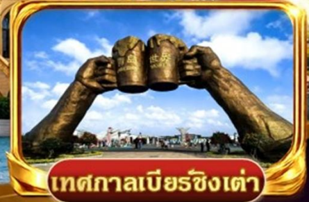
เทศกาลเบียร์ชิงเต่า