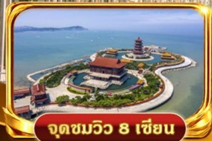
จุดชมวิว 8 เชียง