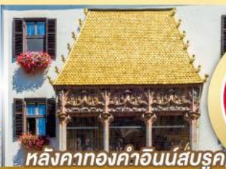
หลังคาทองคำอินน์ส์บรุค