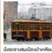
นั่งรถรางชมเมืองต้าเหลียน