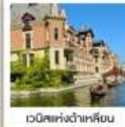
เวนิสแห่งต้าเหลียน