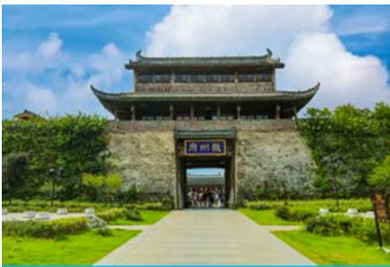
เมืองโบราณฮุยโจว

เช้า รับประทานอาหารเช้า ณ ห้องอาหารของโรงแรม (1)