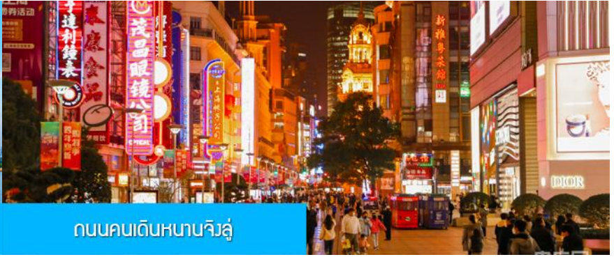
ถนนคนเดินหนานจิงลู่

จากนั้นนำท่านเดินทางสู่ ย่านช้อปปิ้งที่ใหญ่และคึกคักที่สุดของมหานครเซี่ยงไฮ้ ถนนคนเดินหนานจิงลู่ 南京路步行街 ให้ท่านเพลิดเพลินกับการเดินเที่ยว ชม และ ช้อปปิ้ง ชิมอาหารหรือของท่านเล่นอย่างจุใจ ในย่านถนนคนเดินนี้ นอกจากร้านค้าสินค้าแบรนด์เนมจากต่างประเทศแล้ว สินค้าแฟชั่น และสินค้าแบรนด์จีนก็มีให้เลือกอย่างมากมาย ร้านอาหารและเครื่องดื่มก็มีให้เลือกนั่งเลือกชิมมากมาย..