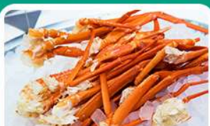
พิเศษ! บุฟเฟ่ต์ขาปู