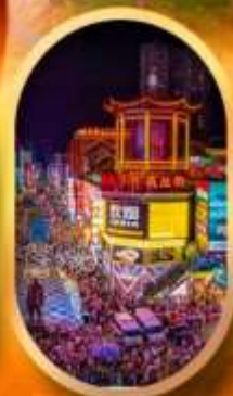
ถนนคนเดินซิงลู่