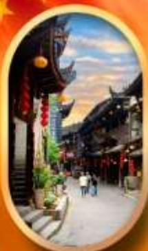
เมืองโบราณฟูหลงเจี้ยน