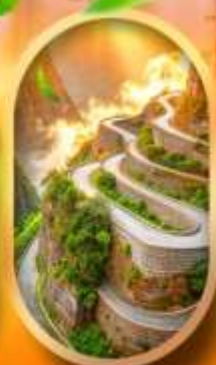
หุบเขาป้ายช้าง