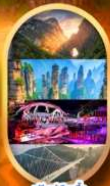
พรีเซ็นเลือกซื้อ Option เสริม