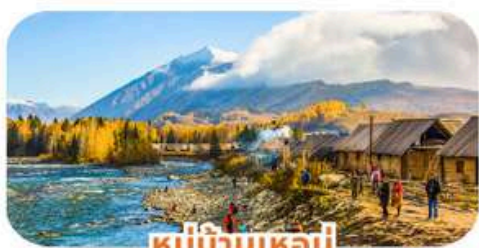
หมู่บ้านเหอมี