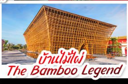
บ้านไม้ไผ่ The Bamboo Legend