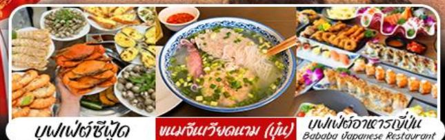
บุฟเฟ่ต์ซีฟู้ด เบนจิ้นริวจินตาม (ญี่ปุ่น) บุฟเฟ่ต์อาหารญี่ปุ่น Bababa Japanese Restaurant