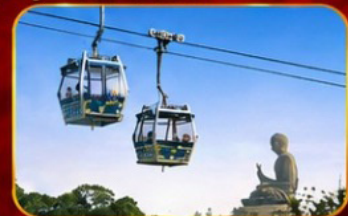
กระเชานองปิง