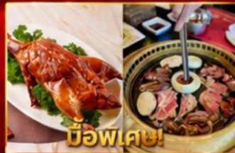
เปิดอย่างฮ่องกง บูฟเฟต์ปิ้งย่างเกาหลี