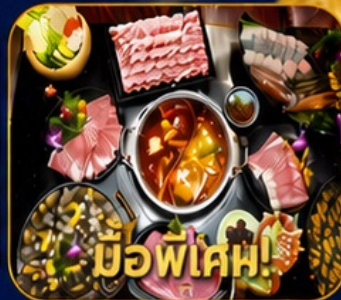
มือพิเศษ! บุฟเฟ่ต์ชาบูสโตร์ฮ่องกง