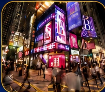
ซุปบึงซินซาฮุย

วัดเจ้าแม่กวนอิมฮ่องกง - ซุปบึงซินซาฮุย - วัดนาจา วัดแชกงหมิว - วัดหวังต้าเซียน