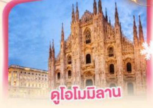
คูโอโมมิลาน