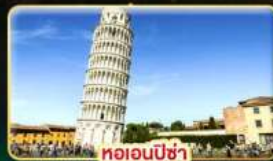
หออนพีซ่า