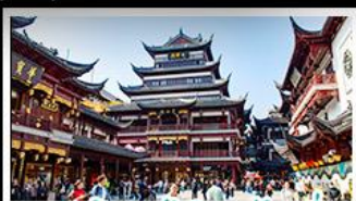
ตลาดร้อยปีเจียงหวงเหมียว