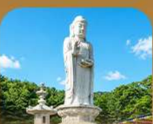
วัดดงซาซา