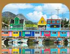
ท่าเรือจันเนิม