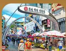
ตลาดนัมโพดง