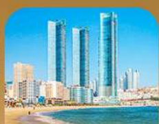
หาดแฮอินแด