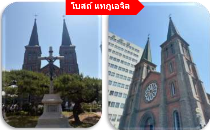
โบสถ์ แทกูเจิล

นำท่านเที่ยวชม โบสถ์แทกูเจิล โบสถ์นิกายโปรเตสแตนต์ที่เก่าแก่ที่สุดใน จังหวัดคยอซังบุก (Gyeongsangbuk-do) ตั้งอยู่ในบริเวณ Cheongna ซึ่งเป็นย่านที่อยู่อาศัยของเหล่ามิชชันนารีที่มาอาศัยอยู่ใน เมืองแทกู