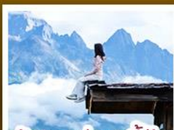
ร้านอาหารเขยูนตันอัน

ชมวิวภูเขาหิมะสวยสุดโรแมนติกกับแสงยามพลบค่ำ เที่ยวเมืองโบราณต้าหลี่ ลีเจียง ไม้ชา แขงกรี่ล่า ชมวิถีชีวิตของชุมชนยูนนานและทิเบต พิสูจน์ความกล้าท้าเดินชมสะพานแก้วลีเจียง • ซุปโป่งเพลินที่ถนนคนเดินหนานผิงเจียง